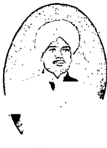
भरसगी डा. सर टेकचन्द, लाहौर